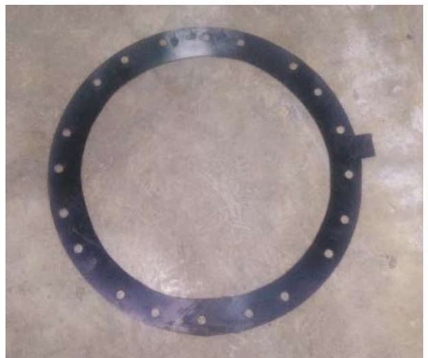
ทำการตัดเปลี่ยน Gasket ใหม่ แทนตัวเดิมที่ชำรุดเสียหาย