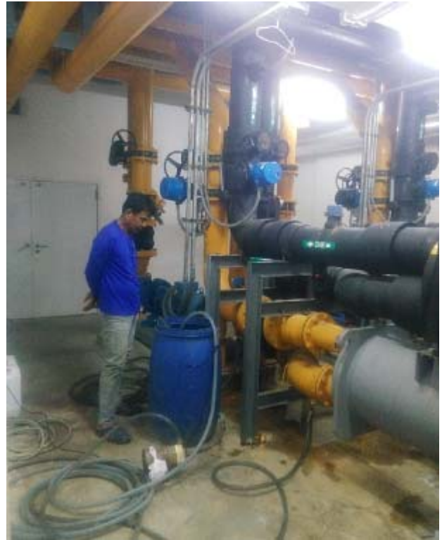
Circulate น้ำยาเคมี 6 ชั่วโมง