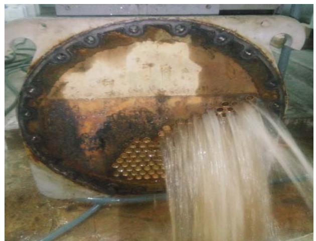
ทำการ Flushing ทำความสะอาดท่อ Condenser หลังแยงท่อเรียบร้อยแล้ว