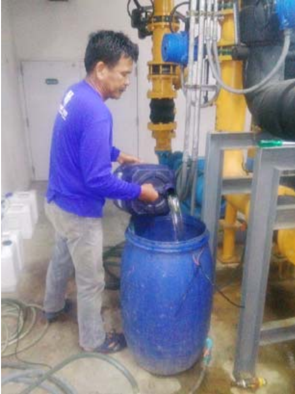
เติมน้ำยาเคมีสารละลาย เพื่อกำจัดตะกอนให้อ่อนตัว