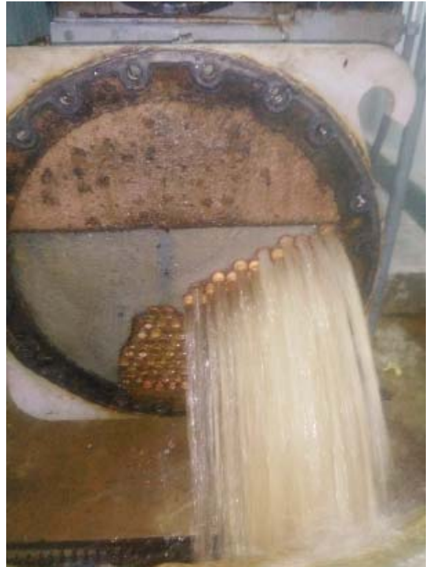
ทำการ Flushing ทำความสะอาดท่อ Condenser หลังแยงท่อเรียบร้อยแล้ว