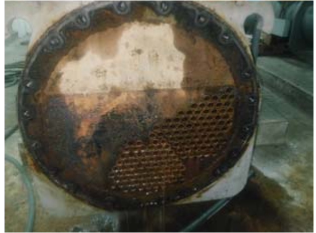
ทำการล้างทำความสะอาด ด้วยเครื่องSpin พร้อมแปรง Nylon Blush