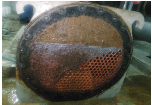
สภาพท่อ Condenser ก่อนทำการล้าง